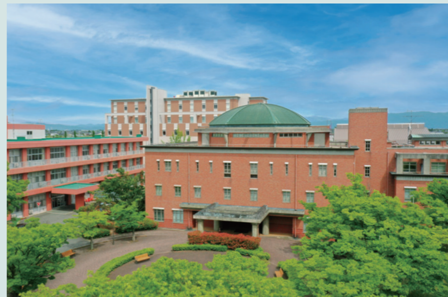
ドーム型図書館のある緑豊かなキャンパス