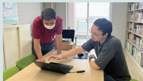
修士論文について教員と議論