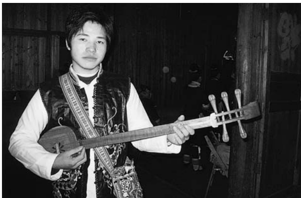
写真D トン族の叙事詩に用いる五弦琵琶 (2007.04)

龍勝各族自治县では、野外に人々が大勢あつまって恋歌を掛け合う行事は、おもにチワン族のもので、この地に暮らすもう一つの少数民族トン族などにはないようです。トン族も恋歌の対唱はしますが、特定の行事に集まることはないと言います。しかし、トン族には優れた音楽文化があります。無伴奏の混声合唱曲に、蟬の鳴き声をまねた代表的な「蟬の歌」があって、すばらしいハーモニーを響かせます。また楽器にも、三味線に似ているが、三弦のほかに四弦または五弦からなる琵琶と呼ばれる撥弦楽器（これには大中小のさらに三種がある）や、その形から牛股琴と呼ばれる擦弦楽器、さらに竹を利用して作った芦笙という管楽器などがあります。