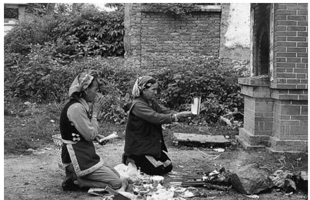
写真I 大理市の本主廟での神々への祈りと供物 (2006)

(この項の詳細については拙稿「少数民族白族の食文化・歌文化 —中国雲南紀行—」『新潟の生活文化』No10、2004を参照して下さい。)