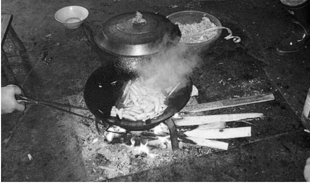
写真G チワン族金竹村の家庭の囲炉裏 (2007.04)