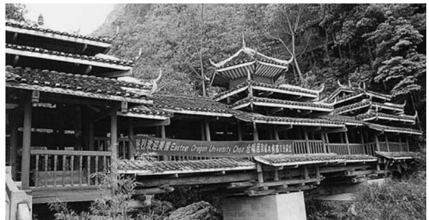
写真E トン族銀水村の風雨橋 (2007.04)

のがトン族の風雨橋と鼓楼です。集落の共同的な建物で、神社仏閣のような宗教施設ではありませんが、人々の精神生活にとって欠かせない建造物となっているようです。風雨橋はチワン族の村にもありますが、村の入口の谷川に架けられる屋根付きの立派な橋で、そこを渡って村に入ります。人々は、雨風の時には野良仕事を休んで、このベンチに腰を掛けて過ごすことから、風雨橋と名付けられたとのこと。また、鼓楼は高く聳える塔で、なかに太鼓を据え付けます。村の集会などが行なわれるとのこと。古老が村の古い伝承を語るのもここだと言います。