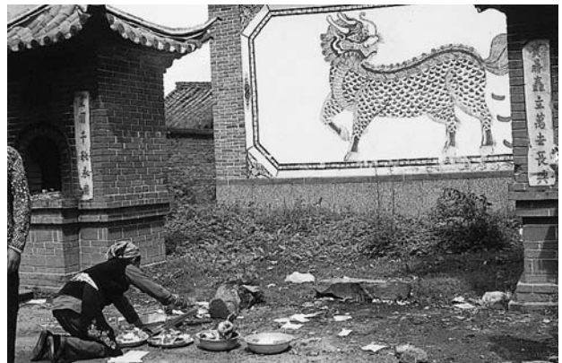
写真H 大理市の本主廟にあった魔除けの照壁

白族には本主廟という神社のような建物があって、信心深い人々の心の拠り所となっている。祭られているのは人間の形をした様々な神像である。人々は病氣平癒をはじめ、たとえば息子の大学受験の合格祈願のような生活上の様々なことを祈っている。そしてその願い事が成就するとお礼参りも行なう。