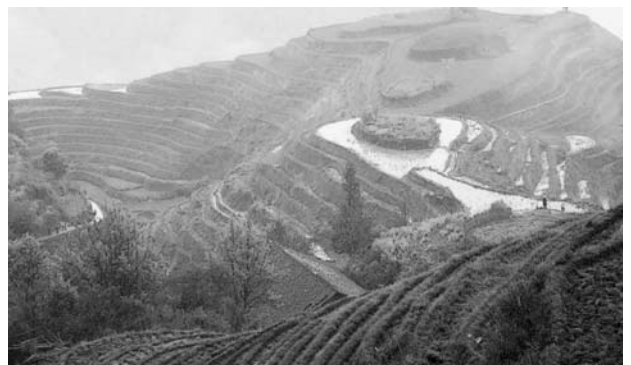
写真C 龍脊の棚田 (2007.04)

この地のチワン族も山がちで厳しい土地で暮らしています。しかし湿度が高く、かなり山の上でも水田を作ることができます。龍脊地区などは山の頂上まで棚田が開け、美しい景観を作っています(下の写真参照)。稲作を