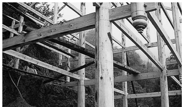
写真F 先端宙吊り柱様式の構造 (2007.04)

山岳地帯に暮らす少数民族の家の多くは、立地の悪い山の斜面に建てられています。龍脊地区のチワン族の木造家屋もその多くが急峻な斜面に建てられています。三階建ての、三、四間に七、八間もあるような家が見受けられますが、崖になっている片側の柱に独特の意匠がこらされます。写真のように、先端の柱を宙吊りにするのです。