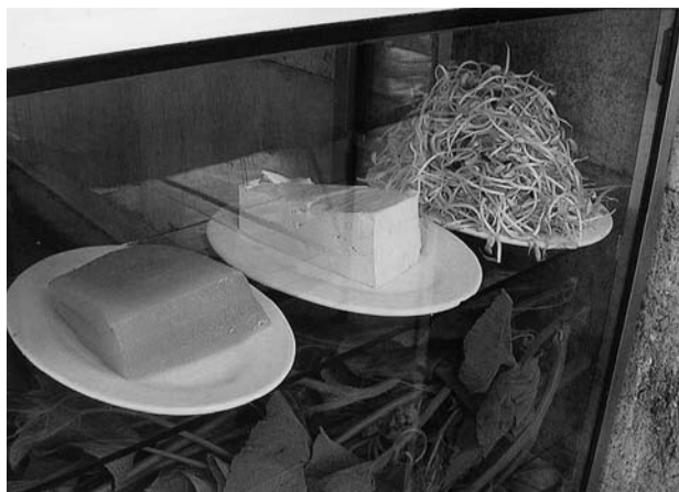
写真A 蒟蒻・豆腐・もやし（2002.08）

雲南省あるいは広西チワン族自治区にかけて行なわれています。またこのあたりは照葉樹林文化と呼ばれ、餅など日本人の食文化との共通性も指摘されています。下の写真を見てください。雲南省の昆明から西へ向かう高速道路のサービスエリアで撮った写真です。食堂の陳列棚にあった食材ですが、蒟蒻、豆腐、もやしです。これらは我々になじみの深い伝統的な食べ物ではないでしょうか。こうした地域に、古代ヤマトに類似した歌の文化があっても本当に不思議ではありません。