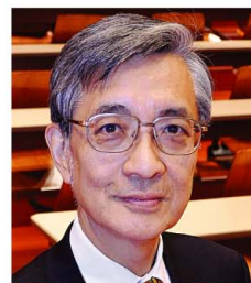
猪口 孝 (司会) (新潟県立大学学長、東京大学名誉教授)