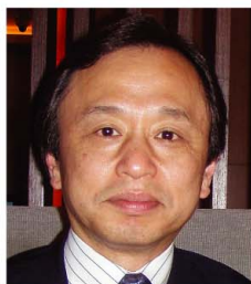
国分 良成 (防衛大学校長、新潟県立大学客員教授)