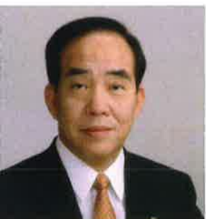
HIRAYAMA, Ikuro Governor of Niigata Prefecture