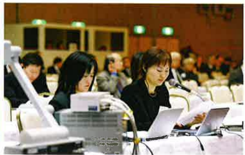
写真は「北東アジア経済会議 2002イン新潟」より。 Photographs taken at the 2002 Northeast Asia Economic Conference in Niigata.