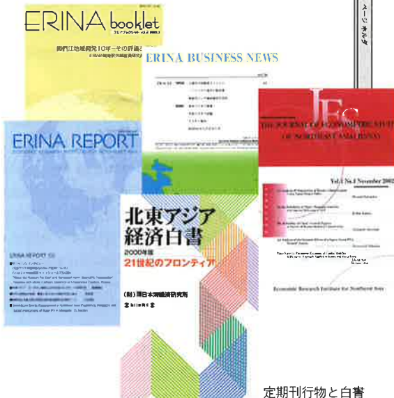
定期刊行物と白書