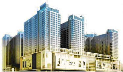
図3 伊勢丹・協和商業広場完成イメージ図

ERINA Economic Research Institute for Northeast Asia