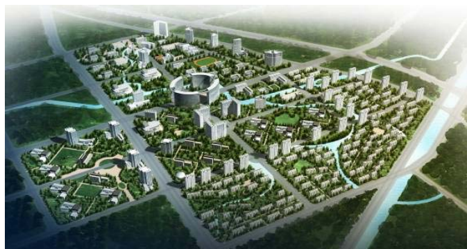
図2 瀋陽国際ソフトウェアパーク完成イメージ図

ERINA Economic Research Institute for Northeast Asia