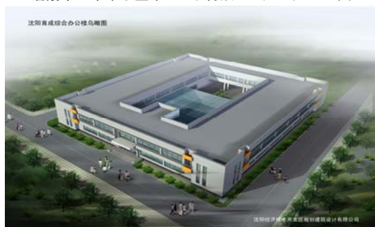
図1 瀋陽市日本中小企業パーク育成センターイメージ図

ERINA Economic Research Institute for Northeast Asia