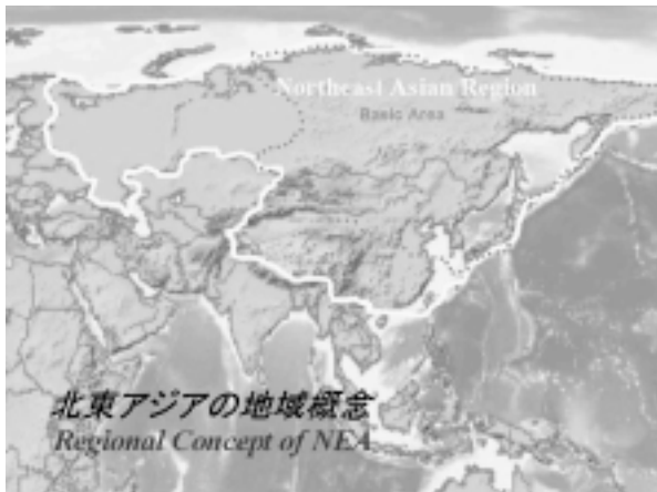
図1 北東アジアの地域概念

経済的な地域統合という面では先輩格のASEAN諸国との協力関係の緊密が昨今話題になっているが、まずもって身近な北東アジア地域内の相互依存関係をさらに緊密にしていくことが重要であり、そのためには各国の資源、資本、技術、労働力の相互補完関係を高めていく必要があると考えている。