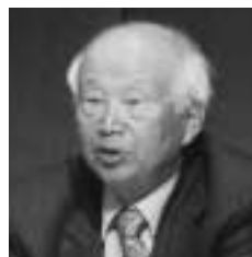
ナム・ドクウ(韓国・元国務総理、産学協同財団会長)

経済、財政関係についての提案が出てきたが、資金はなかなか集まるものではない。しかし、日本の場合、アフガニスタンに対して、2年間で10億ドルを出すことができる。アフガニスタンは日本から何千マイルも離れているのである。そして今、私たちが話しているのは北東アジアのことである。その半分くらいを出していただければよいと思う。そうすれば北東アジア開発銀行を設立することができる。これは非常に大切なポイントであると思う。