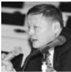
バトバイアル（モンゴル・東北アジア協会会長）

この次には、米ドル、ユーロ、人民元、日本円、韓国ウォンの通貨スワップを含む為替体制をとる必要がある。