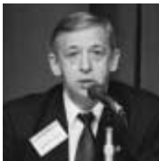
パーベル・ミナキル（ロシア科学アカデミー極東支部副支部長、経済研究所所長）

北東アジアでは、エネルギー、環境の分野も台頭してきている。さまざまな問題点、どのようにして人々の生活水準を上げるのかに対しても、この分野での強力が大変重要になってくる。