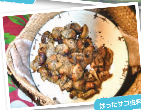
炒ったサゴ虫料理