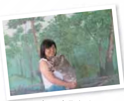
オーストラリアにて

います。思い返せばその時の英語は滞ることなくスムーズに使えたと思います。人間必死になればミラクルが起きるのかもしれないね。是非、皆さんも限界に挑戦して、そのミラクルを起こしてください。