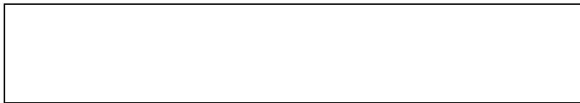
Figure 1 Title of Figure 1